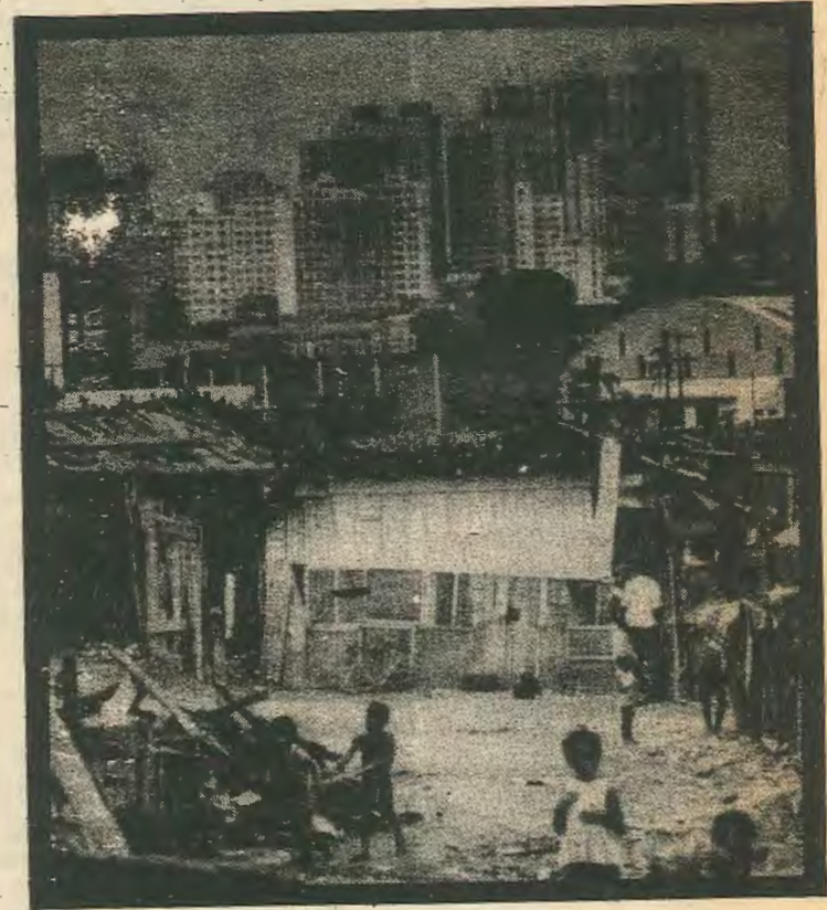
ΣΑΟ ΠΑΟΛΟ, ΒΡΑΖΙΛΙΑ

Για ολόκληρη τη Λατινική Αμερική της οποίας το χρέος ανέβηκε στα 240 δισε-